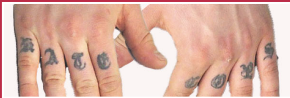
Tattoo - Hate Cops

Wir bitten Sie, Ihre Hinweise +49 (0) 800 855-2055, per E-Mail: lka@polizei.sachsen.de dem Landeskriminalamt Sachsen oder jeder anderen Polizeidienststelle mitzuteilen.