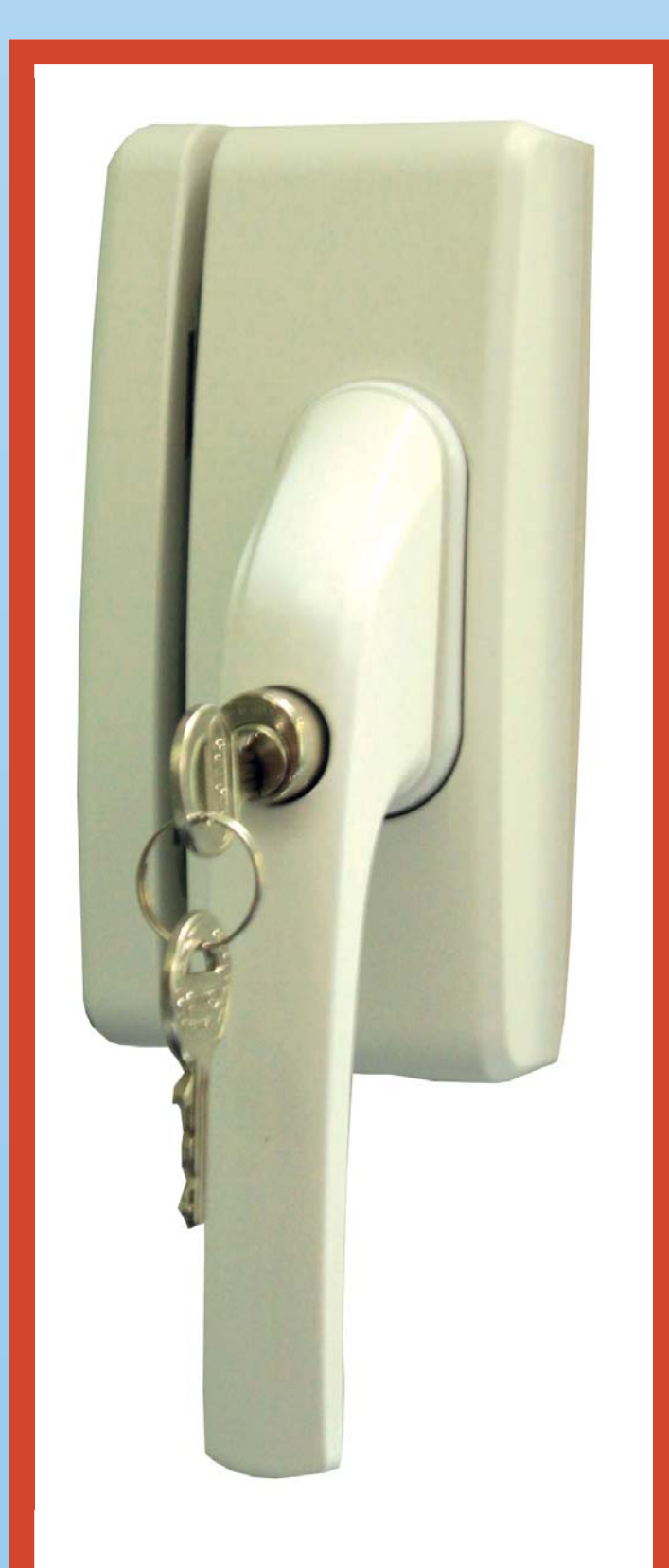
abschließbare Fenstergriffe oder Fensterschlösser