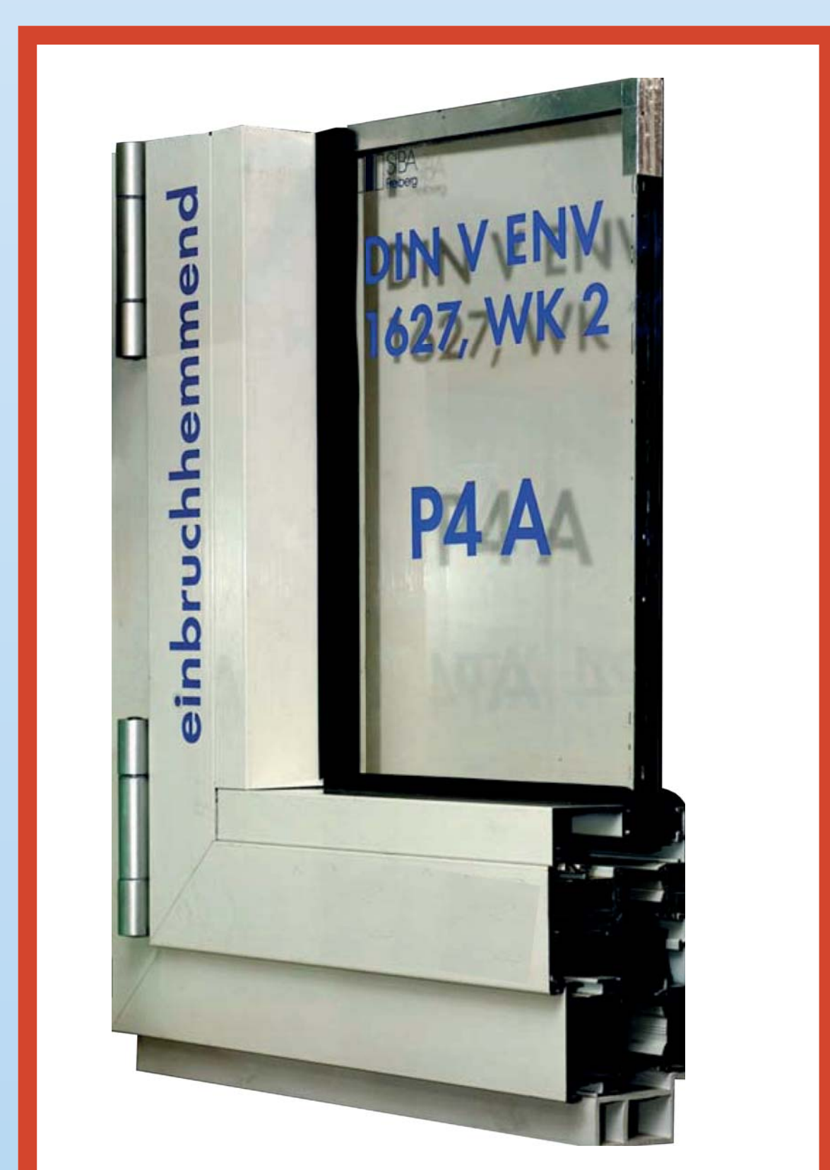
durchwurfhemmende Ver- glasung nach DIN EN 356 in der Widerstandsklasse P4A