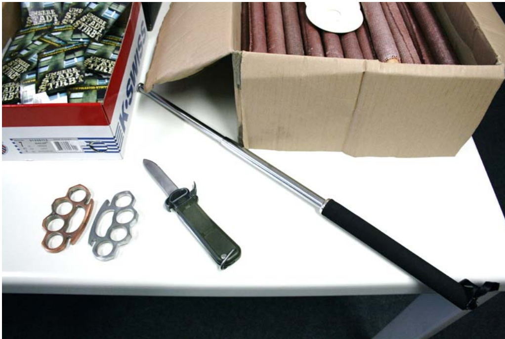
Sichergestellte Schlagringe und Messer und Teleskopschlagstock