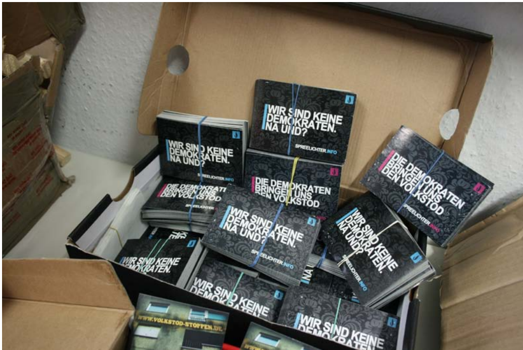
Aufkleber „Wir sind kein Demokraten. Na und?“ und „Die Demokraten bringen uns den Volkstod“