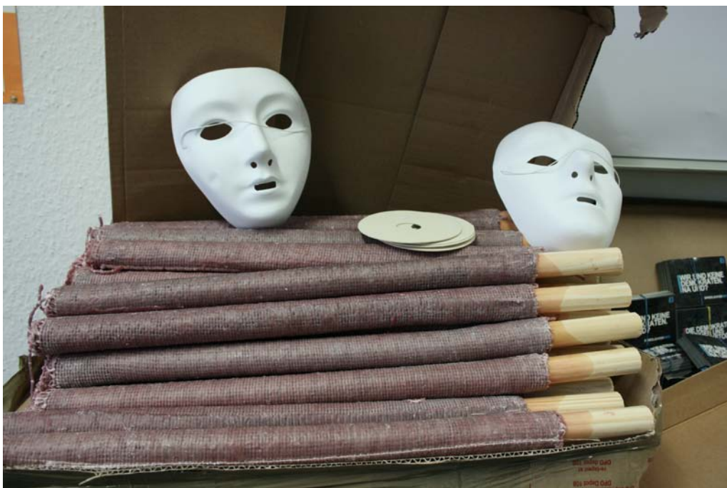
Sichergestellte Fackeln und Masken