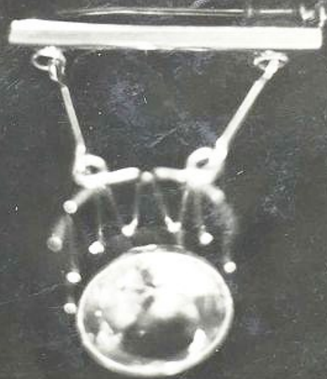
Brosche, analog Anhänger