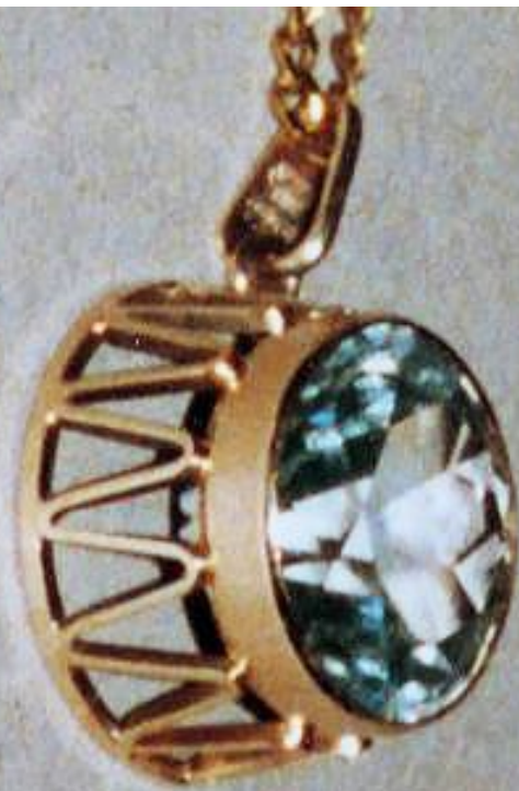
Kettenanhänger, massiv 333er Gold ca. 20 mm Durchmesser, hellblauer Stein, ähnl. Diamentschliff