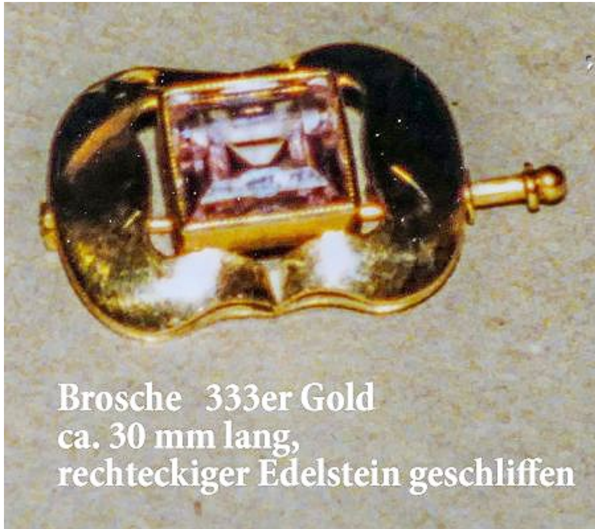
Brosche 333er Gold ca. 30 mm lang, rechteckiger Edelstein geschliffen