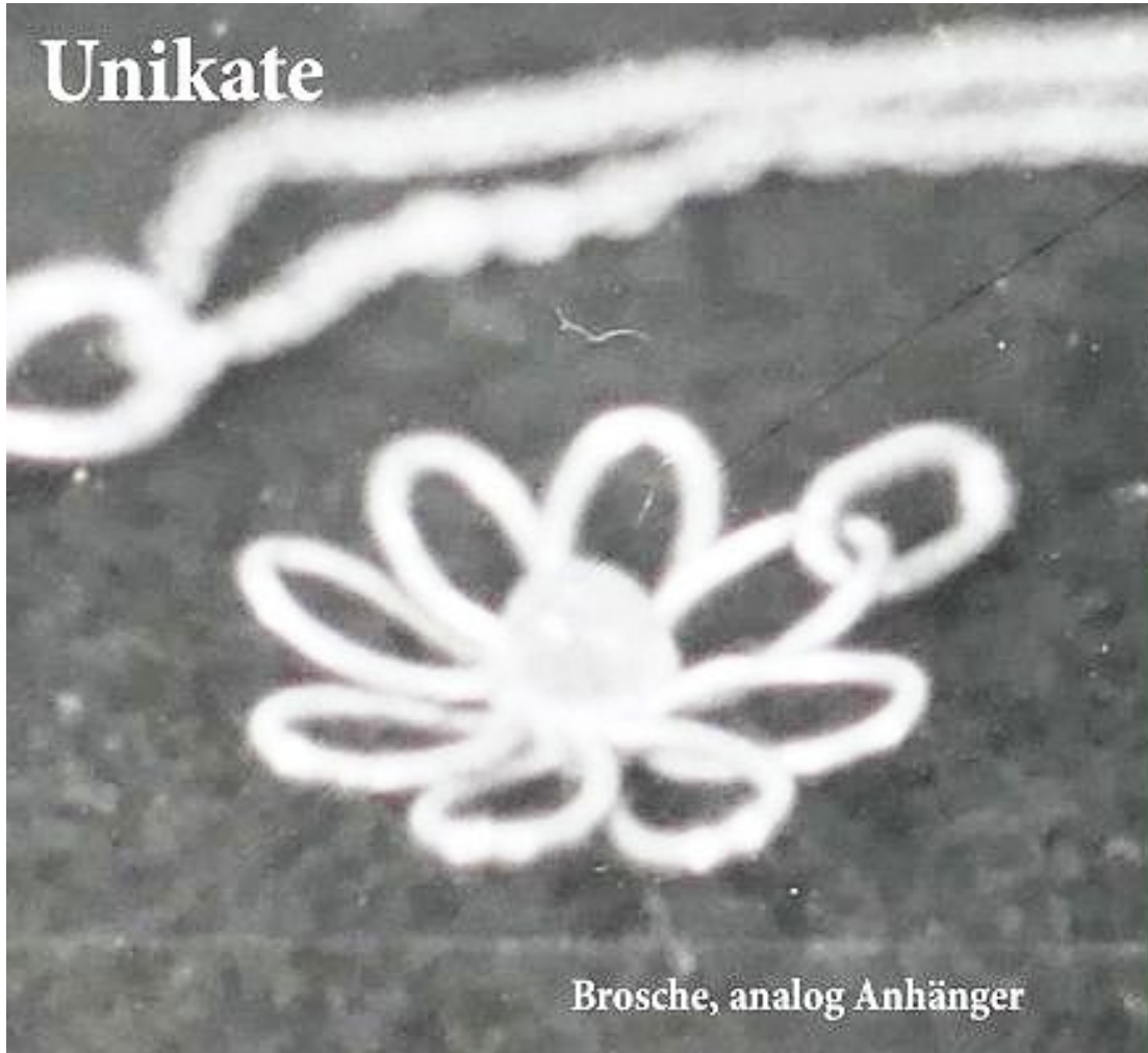
Brosche, analog Anhänger